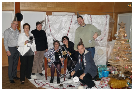
Fêtes de fin d'année