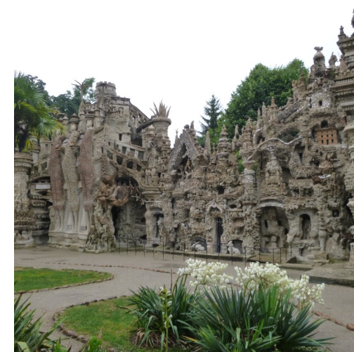
Visite du Palais idéal du Facteur Cheval à Hauterives