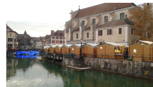
Escapade à Annecy pour le Marché de Noël