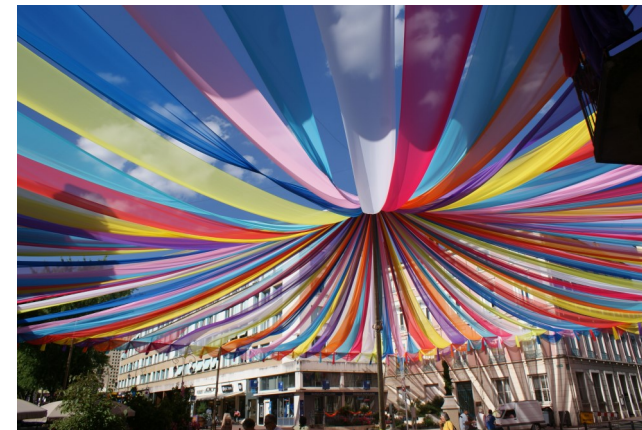
Fête des mousselines. Séjour en gîte. Concerts, restaurants, spectacles etc...