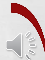
Illustration de l'histoire :

Mise en scène des personnages SIMS dans leur environnement et captures d'écran