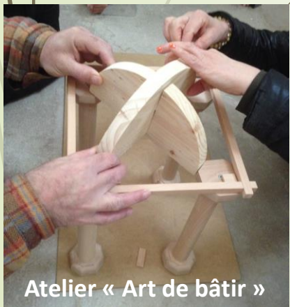
Atelier « Art de bâtir »

L'objectif de ce partenariat était également de sensibiliser les publics spécifiques au patrimoine de proximité par la mise en place d'ateliers autour des arts du Moyen Âge.