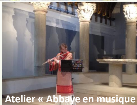
Atelier « Abbaye en musique »