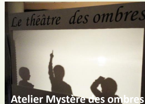
Atelier Mystère des ombres