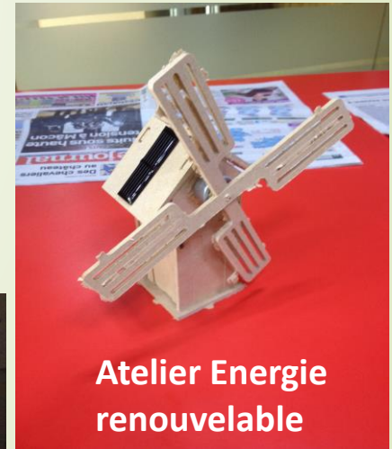
Atelier Energie renouvelable