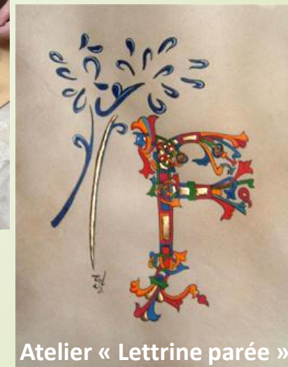
Atelier « Lettrine parée »