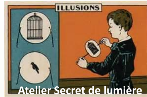
Atelier Secret de lumière