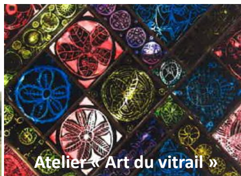
Atelier « Art du vitrail »