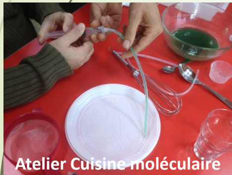
Atelier Cuisine moléculaire

L'idée de la mise en place de ce projet était d'observer et de s'interroger sur ce qui nous entoure , de partager avec les autres sur nos points de vue et expériences sur des thèmes de sciences qui se trouvent au cœur de notre vie quotidienne (le développement durable, la santé, le climat et la biodiversité, les énergies renouvelables, l'eau...).