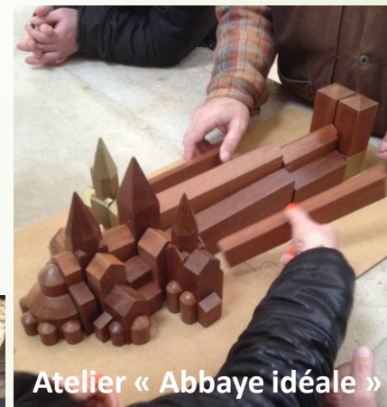
Atelier « Abbaye idéale »