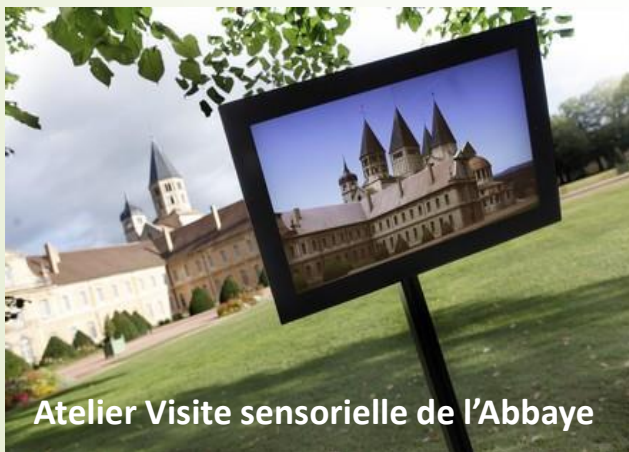
Atelier Visite sensorielle de l'Abbaye